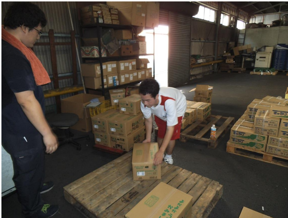
インターンシップの様子